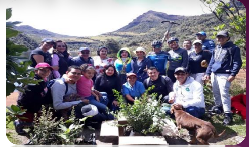
Directivos y funcionarios del Hospital durante la arborización

Comprometidos como es habitual con el cuidado del medio ambiente y la preservación de los recursos hídricos, directivos, funcionarios y colaboradores del Hospital Regional de Sogamoso, bajo la orientación del Comité Ambiental de la entidad, se desplazaron al municipio de Mongua- sector de Laguna Negra - en donde realizaron una Jornada de Arborización de Especies Nativas, además disfrutaron de los hermosos paisajes ofrecidos por la naturaleza y fortalecieron el conocimiento