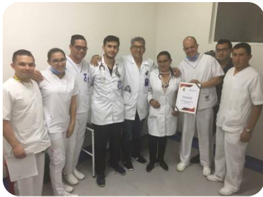
Equipo de trabajo HRS recibe certificación «Hospital Seguro con Excelencia»

Secretaría de Salud de Boyacá la Secretaria Local de Salud, otorgaron al Hospital Regional de Sogamoso certificación como "Hospital Seguro con excelencia" en la implementación de guías de buenas prácticas de seguridad paciente.