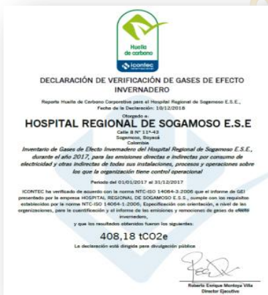
Certificación entregada al Hospital Regional de Sogamoso por ICONTEC

Directivos del Hospital Regional de Sogamoso tras años de trabajo en materia ambiental y consientes de la problemática de cambio climático presente en la actualidad, emprendieron un nuevo reto, el de cuantificar y reducir las emisiones de gases de efecto invernadero – GEI-, producto de la prestación de servicios de salud. Por esta razón y tras la implementación del Plan Anual de Acción elaborado por el Comité Ambiental de la Institución se adelantó la inscripción de la